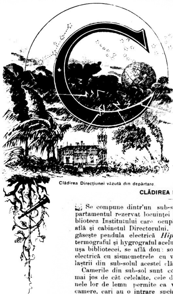
Clădirea Direcțiunii văzută din depărtare.

mează intrarea. Aleea după o distanță cam de 20 m se bifurcă; ajuns aici, crezi că te afli în fața unui castel de prin timpurile medievale—clădiri caracteristice celor din timpii moderni. De jur împrejurul clădirilor sunt ale bine îngrijite cari se pierd în plantații și grădini cu arbori fructiferi. Institutul meteorologic, de cum o situat în această poziție admirabilă, mai mult poetică îți amintește de frumoasele poziții ale castelelor din occident în cari trăiau odinioară Lorzii, Pairii, și Marchizii.